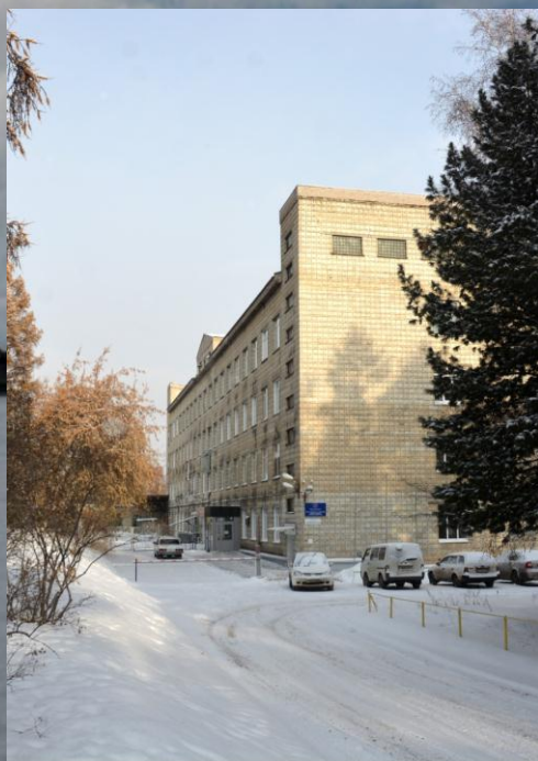
Институт геохимии им. А.П. Виноградова СО РАН, основан 29.11.1957

в г. Иркутск, пос. Листвянка, г/к «Прибайкальская»